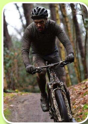
Ward in de Hel van Kasterlee op 24/12/2019

Wij hebben een wishlist, een lijst met dromen die wij nog willen realiseren, maar waarvoor de middelen ons ontbreken. Bedrijven of serviceclubs die ons willen steunen, kunnen deze wishlist opvragen via info@vzwwvictor.be . Enkele voorbeelden van onze dromen: uitbreiding van onze docuimte met nieuwe boeken/materialen, vrijetijdsactiviteiten voor personen met autisme, extra man- of vrouwkracht om de wachtlijstproblematiek aan te pakken, steun bij de inrichting van ons eigen huis... een plek onder de zon.